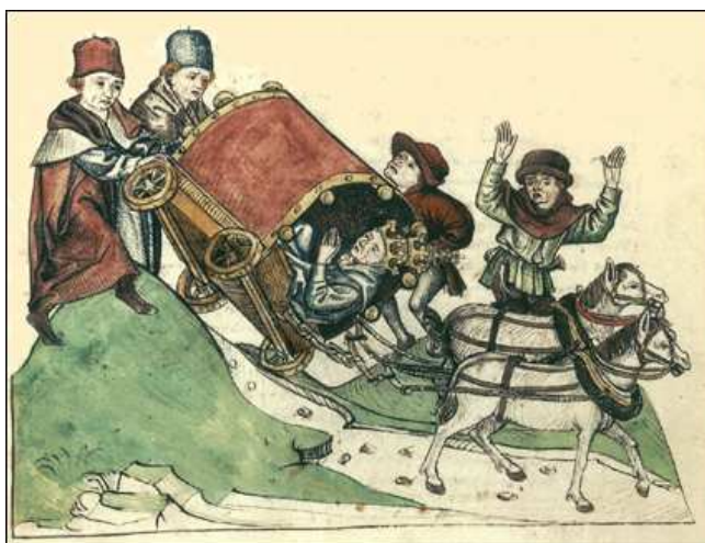
Abb.:Sturz Johannes' XXIII. auf der Fahrt zum Konzil, Richentalchronik

Im Spätsommer 1414 brach Johannes XXIII. nun also nach Konstanz auf. Sein Weg führte ihn über die alte römische Kaiserstraße, die Via Claudia Augusta, welche die germanischen Provinzen mit Italien verband. Um nach einem Zwischenstopp in Innsbruck nach Konstanz zu kommen, reiste er