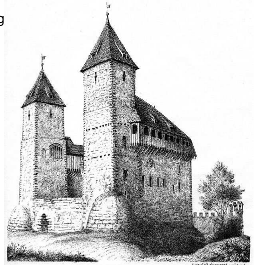
Abb.: Rekonstruktion des mittelalterlichen Schlosses Gottlieben

Man setzte ihn schließlich in Schloss Gottlieben fest, im selben Kerker, in dem auch Jan Hus gesessen hatte. Später überführte man ihn nach Mannheim. Nach Ende des Konzils ließ man ihn gegen ein hohes Lösegeld frei. Im Dezember 1419 starb Cossa als Kardinalbischof von Tusculum in Florenz, wo er ein von den Medici finanziertes und von Donatella gestaltetes Grab erhielt.